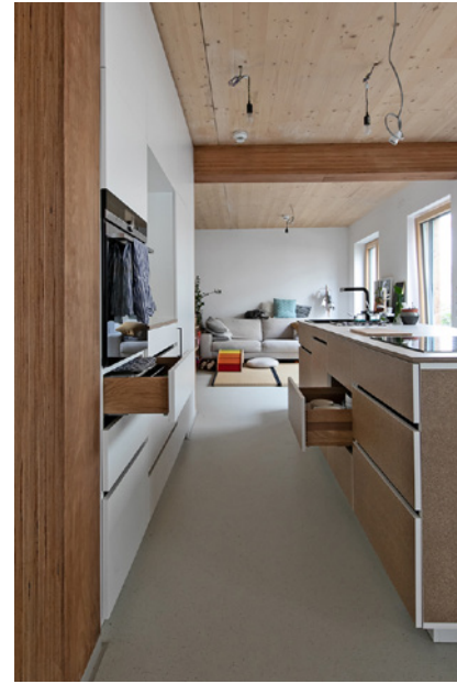
Wohnraum mit Maßküche