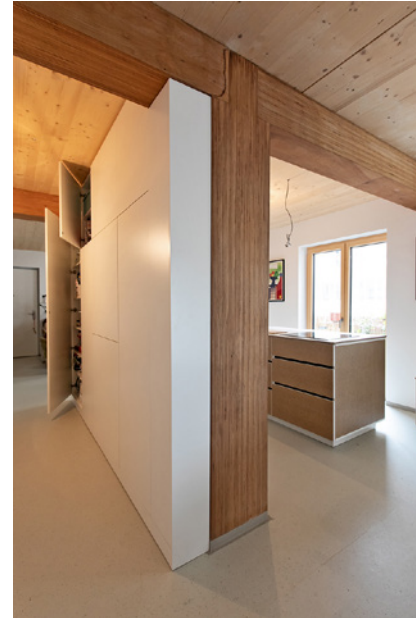
Rückseite Küchenzeile mit eingebauter Speis