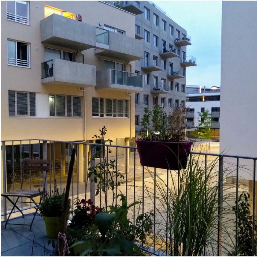
Ausblick Balkon Richtung Stadtelefant